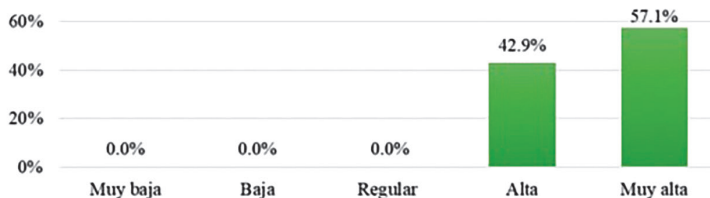
Figura 5. Distribución de la variable Solicitud de retiro

Se observa en la tabla 8 y figura 5; que el 57.1% de la población señala de una importancia muy alta la solicitud de retiro, y que el 42.9% la percibe como alta.